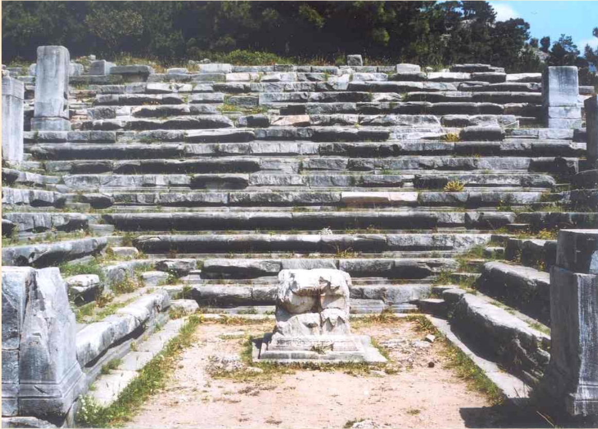
Şekil 5: Bouleuterion

Kent meclisi toplantılarının yapıldığı kapalı yapılardır. Agora'nın demokrasi ile olan yakın ilişkisinden dolayı bouleuterionlar, genellikle Agora'ya yakın yapılmışlardır. Bu tür yapılara, Priene ve Miletos bouleuterionlarını örnek verebiliriz.