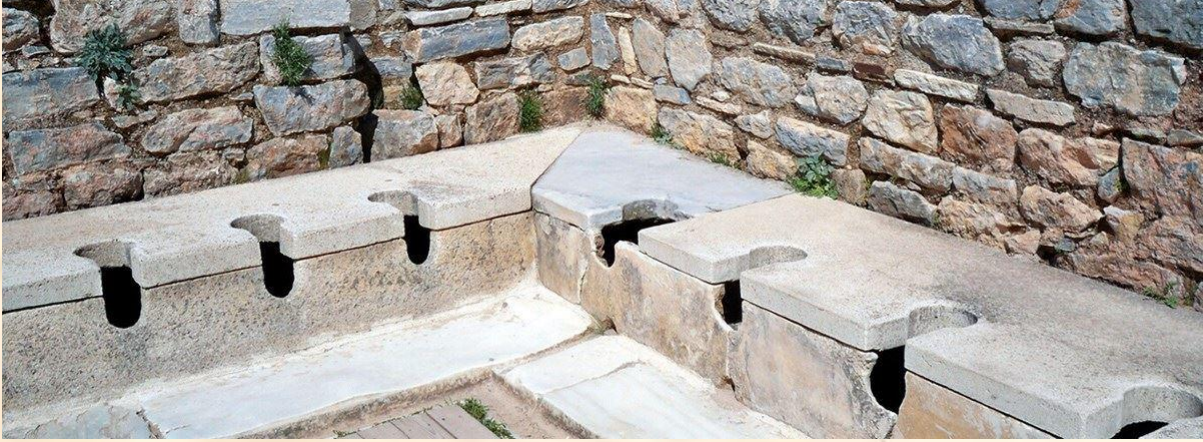
Şekil 8: Latrina (Kamusal Tuvalet)