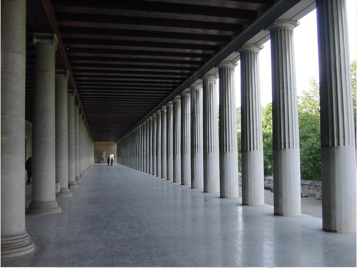
Şekil 3: Antik döneme ait bir stoa / eyvan