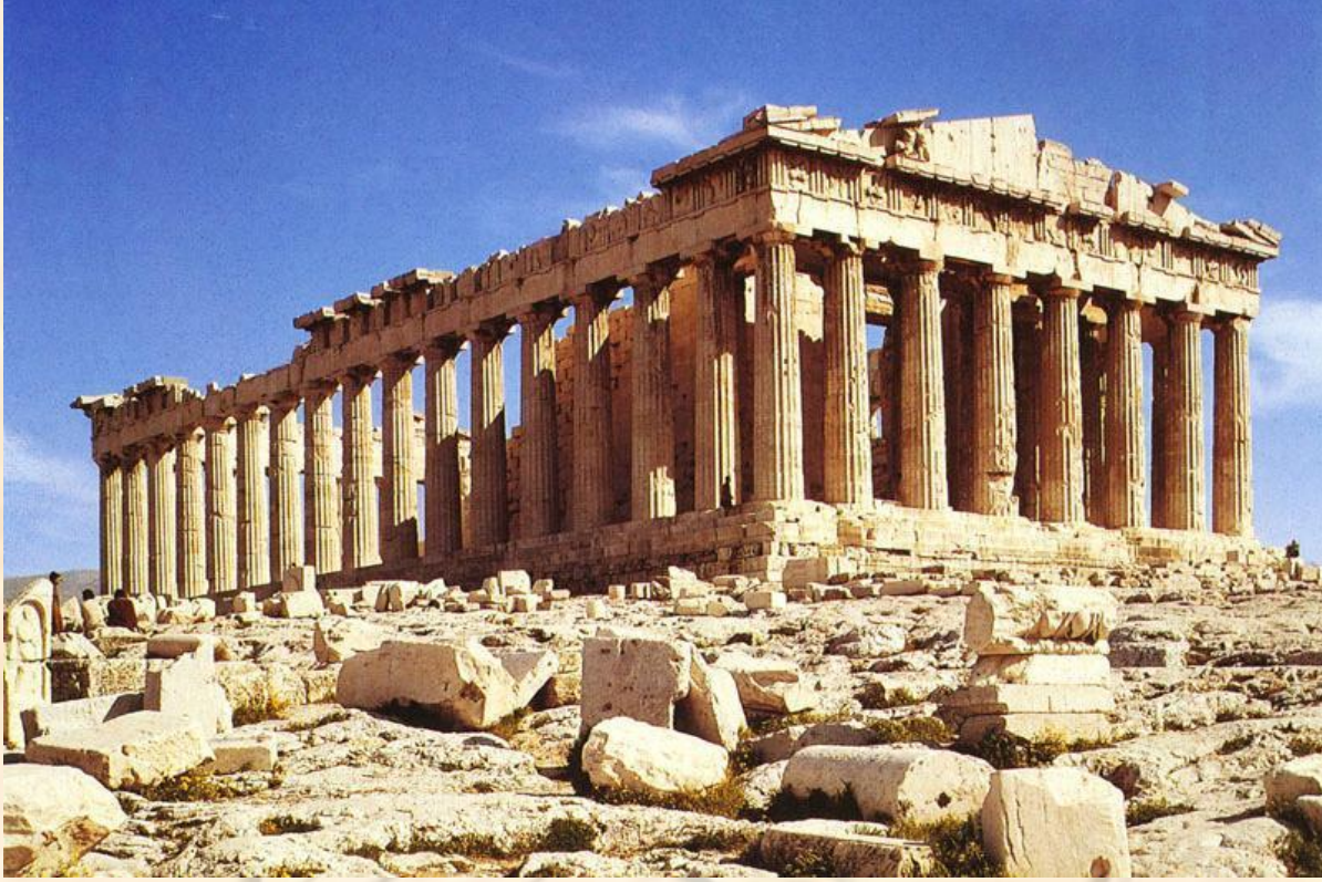
Şekil 1: Antik döneme ait bir Akropol (Kale)