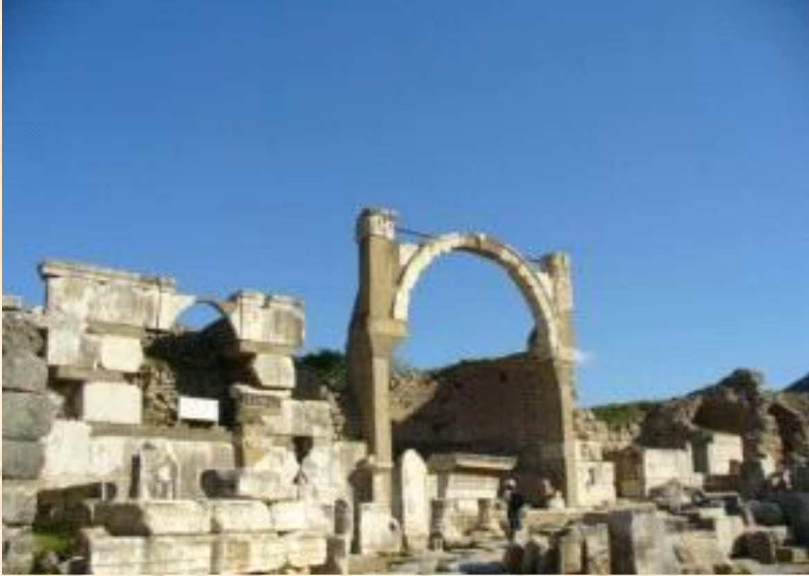
Şekil 7: Khalkidikum

Khalkidikum yapıları bir nevi resmi yazışmaların depo edildiği, arşiv binalarıdır. Bu yapının, daha çok resmi yazışmaların yoğunlaştığı dönemlerde yapılmaya başlandığını görüyoruz. Bu da, daha çok Roma dönemine rastlamaktadır. Bu yapılar, devlet Agoraları içerisinde yer almışlardır. Zaten kentte var olan diğer resmi yapılar da, bu agorada yer almaktadırlar. Khalkidikum yapısı ise, bu resmi yazışmaları, arşivlemek amacıyla yapılmıştır. Bu tür yapılara Ephesos'taki " Khalkidikum " yapısını örnek verebiliriz.