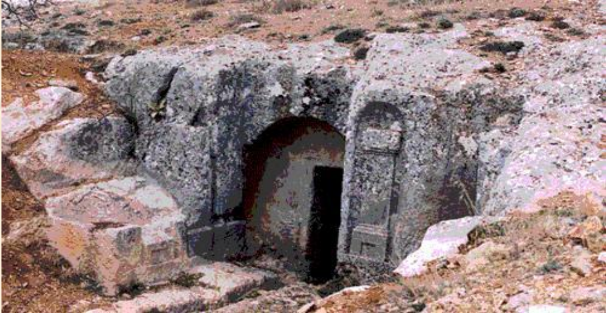
Resim 10: Antik dönemin en klasik yapılarından birisi. İster liman kenti olsun ister hinterlanda bir kent olsun, yer altı konuşlanması her açıdan en idealiydi.