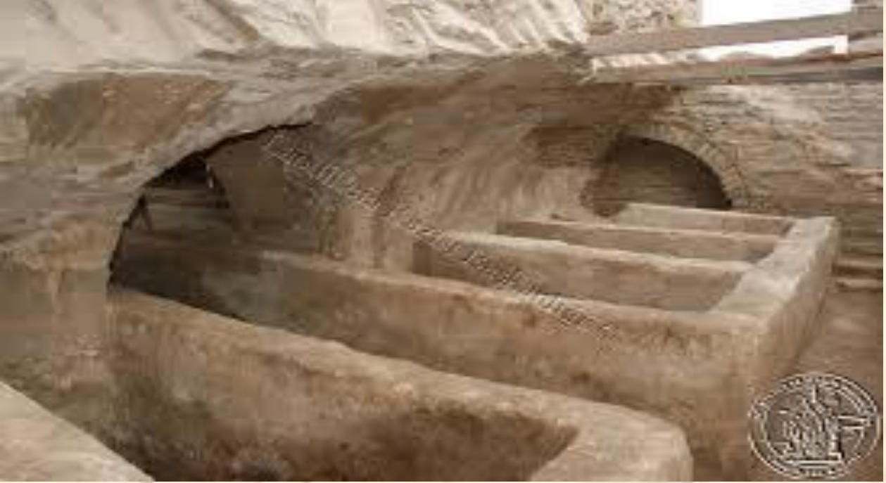
Şekil 2: Antik döneme ait bir Nekropol

Antik Çağ'da mezarlık diyebileceğimiz bu alan, her ne kadar kent alanının dışındaysa da, zamanla kentlerin büyüüp gelişmesiyle, kentsel alan içerisinde de kalabilmiştir. Örneğin; Termesos (Güllük Milli Park) kentindeki nekropolde, anıtsal özellikler gösteren “Aslanlı Mezar” gibi çok sayıda bölgeye özgü lahit mezar bulunmaktadır