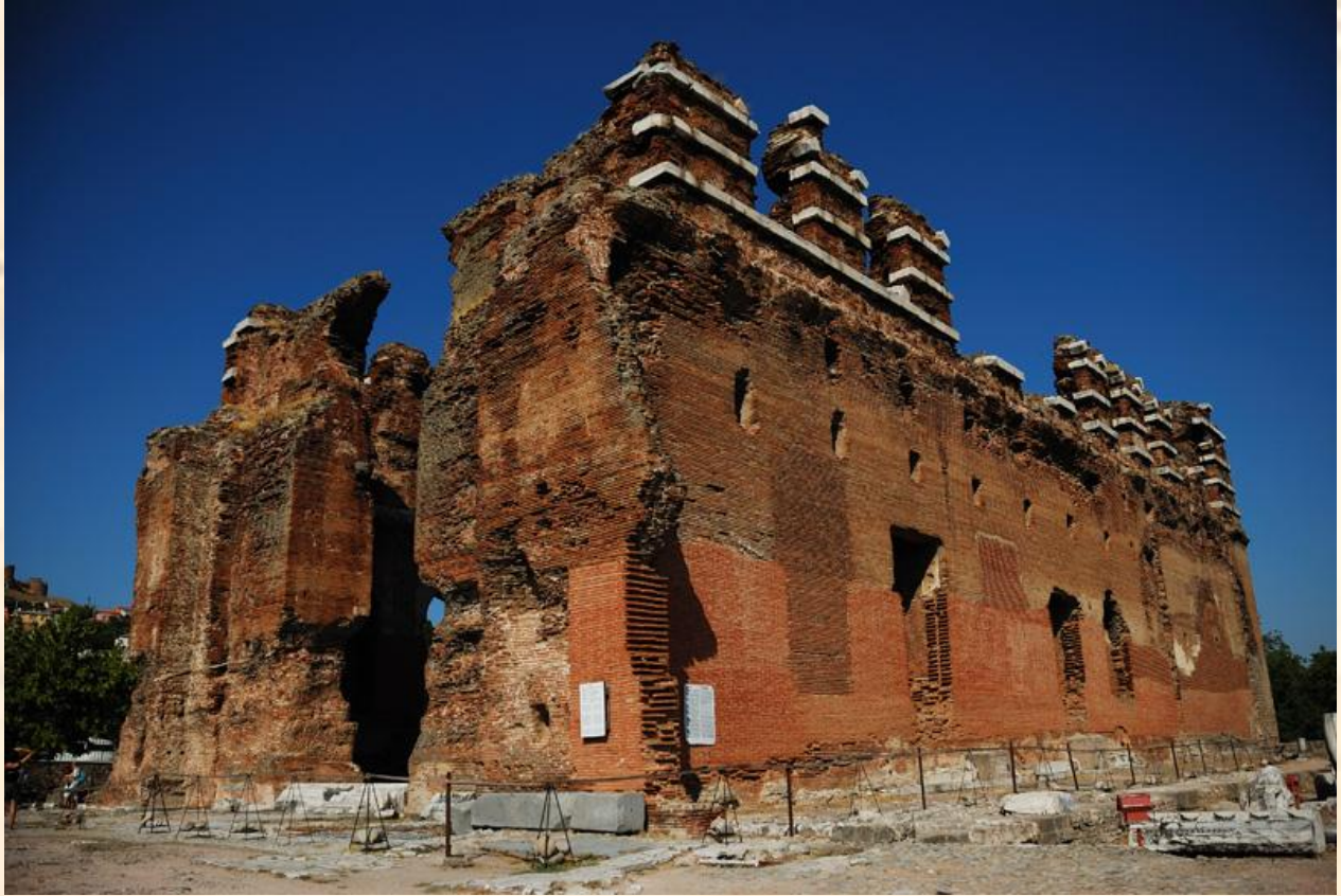
Şekil 6: Bazilika

Bazilika daha çok Roma döneminde inşa edilen yapılardan biridir. Üç salondan oluşan bu yapı, bir nevi mahkemelerin bulunduğu adliye binasıdır. Bazilikaların çoğunda yargıcın oturması için tribunalar bulunmaktadır. Hıristiyanlığın yaygınlaşmasından sonra, bu adli bazilikaları örnek alan, dinsel bazilikalar da yapılmıştır.