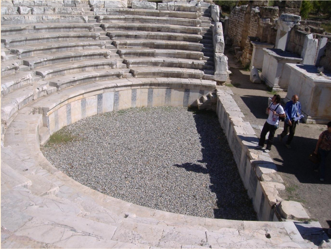
Şekil 4: Antik döneme ait odeon

Zaten Roma döneminde kentlerde daha çok Odeon yapıları inşa edilecektir. Örneğin; MS. 2. yüzyılda Ephesos kentinde yapılan Odeon, resmi toplantıların yapıldığı bir yer olmanın yanı sıra, konserlerin de düzenlendiği bir yapı özelliği göstermektedir.